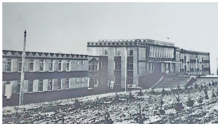
Clădirea la început

Colegiul „Gheorghe Asachi” din Lipcani, continuă să rămână unica instituție din nordul țării, care pune accent pe specificul vocațional pedagogic, promovarea valorilor fundamentale ale educației, învățământul de calitate, racordat la schimbările și viziunile moderne din educație.