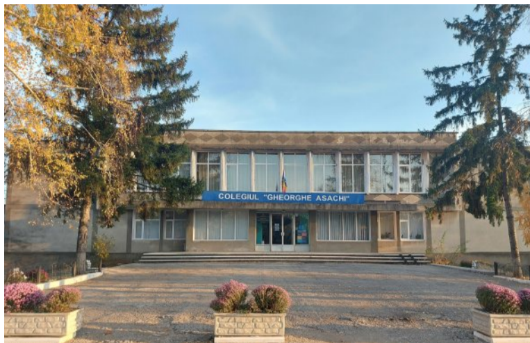
Blocul administrativ actualmente

În 1992 Școala Pedagogică „Gheorghe Asachi” din Lipcani a fost reorganizată, prin HG RM Nr.431 din 23 iunie 1992, în Școala normală-liceu „Gheorghe Asachi” din Lipcani. În anul 1998 Școala normală-liceu „Gheorghe Asachi” din Lipcani