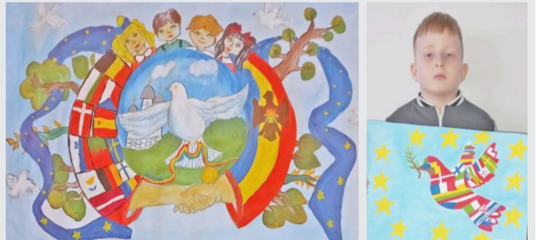
Desen de Arsenie Postolachi

Elevii Liceului Teoretic „Mihai Eminescu” din Edineț demonstrează prin desen „Cum văd ei Moldova Europeană”.