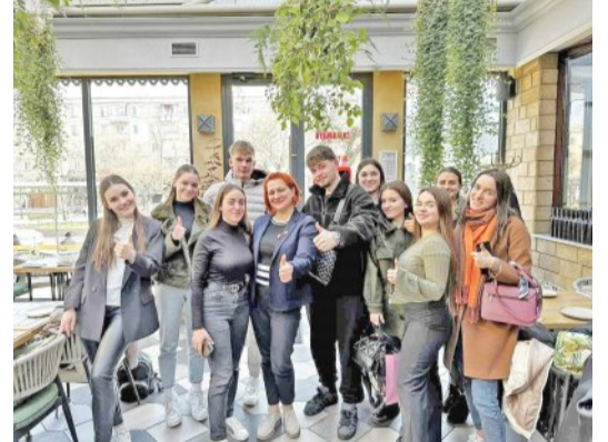
Impactul formării practice asupra integrării elevilor în câmpul muncii