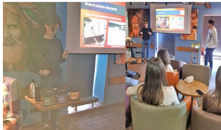
Masterclassul „Etaple de aranjare a mise-en-place” (restaurantul „Garden Palace”)