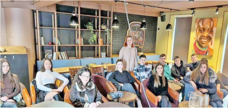
Prezentarea și degustarea cafelei (cafeneaua TUCANOCOFFEE)

A ceste activități au scopul de a inspira dragostea pentru profesie în rândul viitorilor specialiști din domeniul alimentației publice. În cadrul educației profesionale, formarea practică joacă un rol esențial în pregătirea tinerilor, pentru a excela în industria ospitalității. Vizitele de studiu și masterclassurile sunt instrumente de învățare valoroase, care completează cunoștințele teoretice și permit studenților să asimileze cele mai bune practici din industrie.