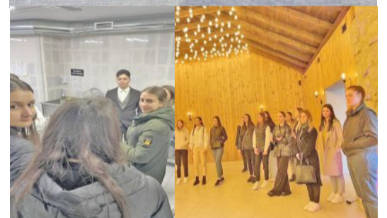
Prepararea bucatelor georgiene și analiza meniului (restaurantul „Cikapulya”)

experiență educațională le-a permis nu doar să învețe de la profesioniști, dar și să-și construiască o rețea valoroasă de contacte și să obțină un avantaj competitiv pe piața muncii.