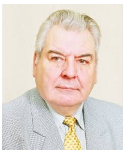
Academician Mihai CIMPOI

Azi, amintirile dor! Dar atunci podul era plin de chipuri îngheșuite, cu buchețele mici de flori în mâini și, într-o clipă, o ploaie multicoloră a acoperit zăbranicul apei trezite din somnu-i adânc. Flori, multe flori pentru jinduțul Prut! Fiecare buchețel purta în sine căldura unei ființe,