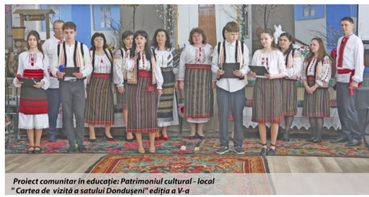
Proiect comunitar în educație: Patrimoniul cultural - local "Cartea de vizită a satului Dondușeni" ediția a V-a

[Casetă de dialog spontan] Unul dintre elevii moderatori, în timp ce pregătea suvenirurile, șoptea: „Sper să le placă, e făcut cu dragoste”. Aceasta este, probabil, cea mai autentică formă de evaluare a proiectului.